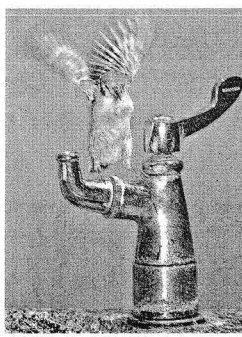
最優秀作品賞「水を求めて」

バルブの写真と、それを付けて、毎年3月21日に相応しい川柳にタイトル「バルブの日」に合