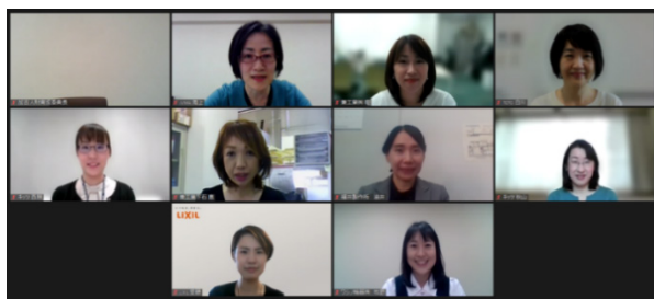
Zoom でのインタビューの様子

インタビューについては、女性活躍推進に関する課題や好事例、経験談など、伺った情報について広く web 等で公開し、会員企業に有益な情報を提供するとともに、NWメンバー自身の視野を広げ、モチベーションアップにつなげることも目的としています。